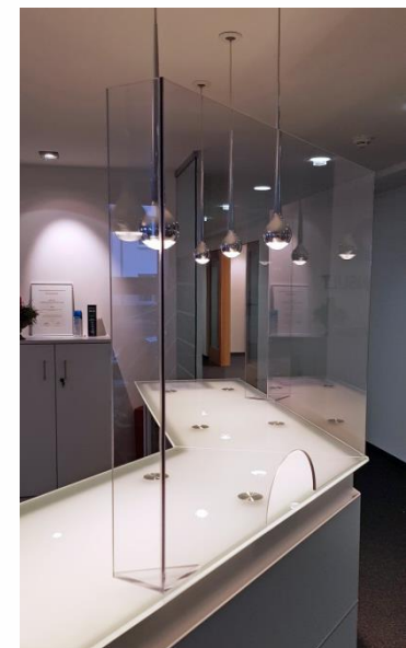
Individuelle Sonderanfertigungen in beliebigen Größen und Formen. Eingefasst in einer Rahmenkonstruktion.