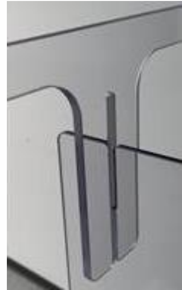
Infektionsschutzwand als Aufsteller mit 2 Stellfüßen. Plattenstärke: 4, 6 oder 8 mm