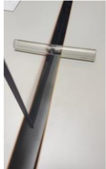
Trennscheiben als Stecklösung bei gleich hohen Schreibtischen. Breite: 1495 mm, Höhe: 640 mm. Lieferbar mit oder ohne Kabelschacht.