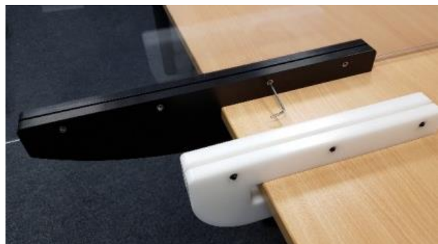
Klemmhalter, schwarz – Überstand bis 900 mm

Lieferbar in verschiedenen Höhen und Breiten. Befestigung mittels Klemmhalterung, Höhe und Überstand der Platte variabel einstellbar.