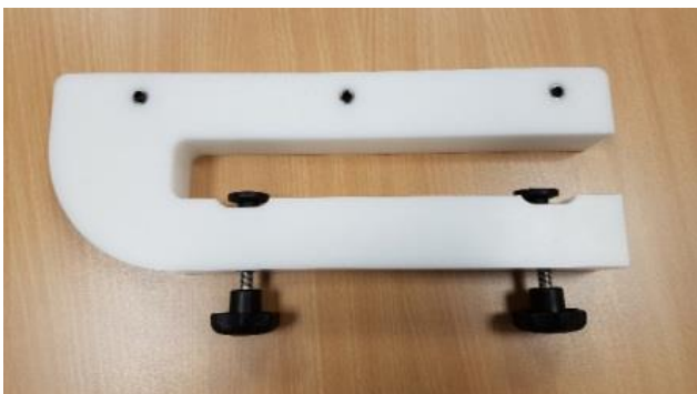
Klemmhalter, weiß – Überstand bis 300 mm